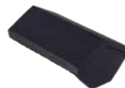
zadel begin- en eindvorst